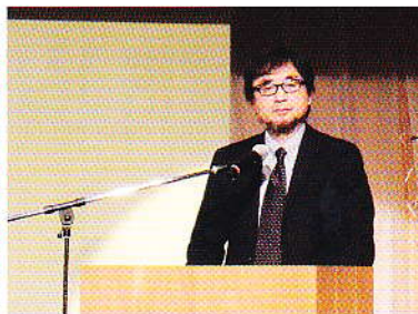
震災追悼メッセージ