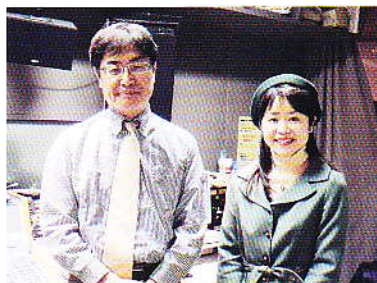
震災を振り返って