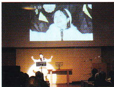
昨年の「追悼のつどい」より